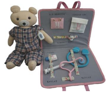
「ナースごっこ」 (製作：布おもちゃグループ「ポケット」)

趣味とボランティア活動が一体となったグループ“ポケット”が製作した布おもちゃや布えほんを、無料で貸し出しています。月1回布おもちゃ親子サロン“ポケット”ひろばで遊ぶこともできます。