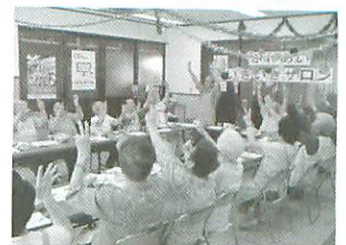
ふれあいいきいきサロンの様子