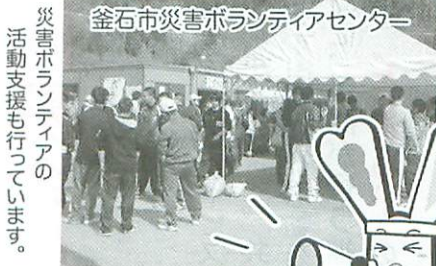
災害ボランティアの活動支援も行っています。