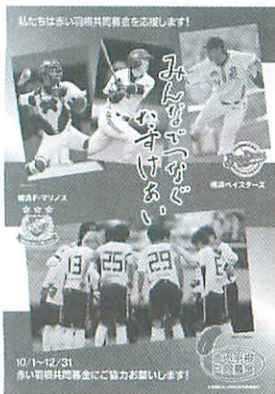
平成23年度 寄付金配分計画