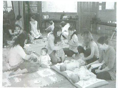
子育てサロンの様子

少子化、核家族化が進み、未来を担う小さな子どもたちを持つお母さんの中には、日中、一人きりで子育てをし、相談ができず、不安や悩みを一人で抱え込んでしまいがちな人も少なくありません。 共同募金は、そんなお母さんたちが、気軽に歩いて行ける、身近な地域での「子育てサロン」にも使われています。